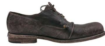
Shoto Halbschuh Känguruleder 540,00 €