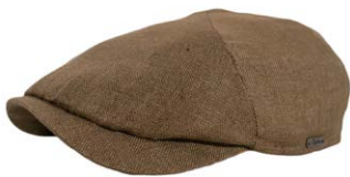
Wigens Newsboy Slim Cap Leinen Braun 100,00 €