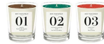
Bon Parfumeur Duftkerzenset Mini 65,00 €