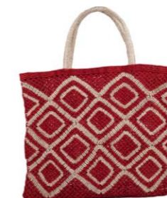
Ingrid rot 120,00 €