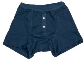
Merz b. Schwanen Boxershorts marine 40,00 €