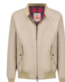
G9 Blouson Natural 390,00 €