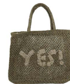
Yes Oliv 120,00 €