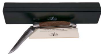
Forge de Laguiole Mooreiche Custom Made 450,00 €