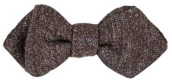
Blick Schleife Andre Braun 50,00 €