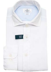
Hackett Leinenhemd 129,95 €