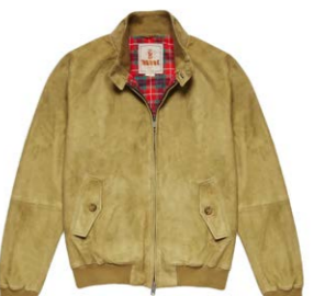
G9 Suede Blouson Army 700,00 €