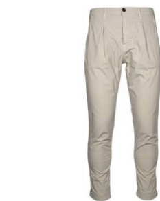
The.Nim Chino aus Baumwolle 160,00 €