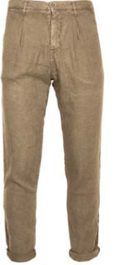
The.Nim Chino aus Leinen 170,00 €