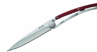
Deejo WOOD Korallenholz 37g 55,00 €