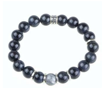
OE-18-001 Meteorit 300,00 €