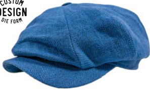
Wigens Newsboy Cap Leinen Royalblau 100,00 €