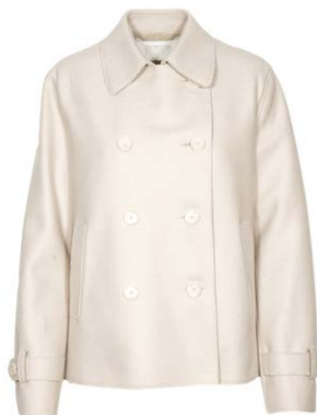
Harris Wharf Caban Natur 500,00 €