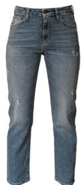
The Nim Jeans Janis Regular Fit 189,95 €