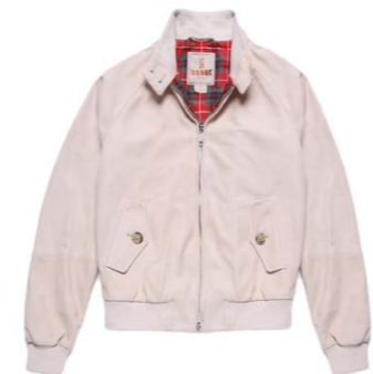
Damen G9 Suede Blouson Powder Rose 690,00 €