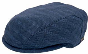
Wigens Ivy Slim Cap Blau 100% Leinen 70,00 €