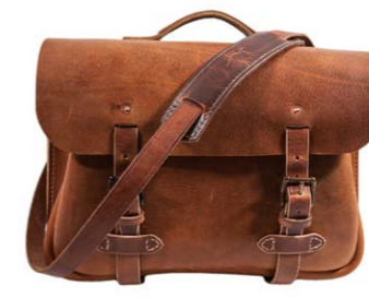
Kustom Kraft Workaday Ledertasche 750,00 €