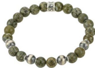
20-015 Krokodil 130,00 €