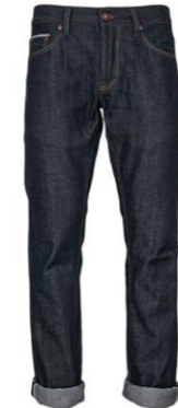
schmaler Blaumann deutscher Denim 14,5 oz 280,00 €