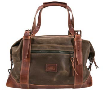
Kustom Kraft Weekender Tan 500,00 €