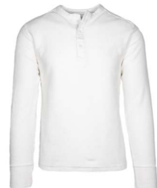
Original Vintage Style Henley Strip 160,00 €