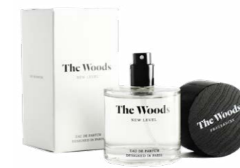
The Woods New Level 69,95 €