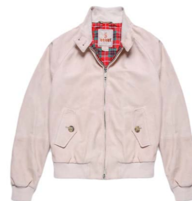
Baracuta Damen G9 Suede Blouson Powder Rose 690,00 €

Alle Produkte in diesem Newsletter sind klickbar!