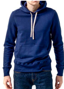
Merz b. Schwanen Kapuzenpullover 180,00 €