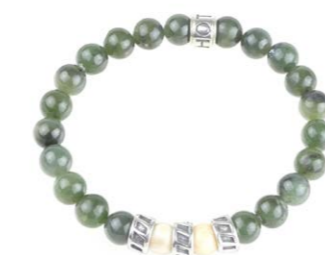
E-18-003 Mammut Elfenbein Jade 240,00 €