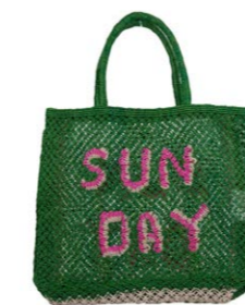
Sunday 90,00 €