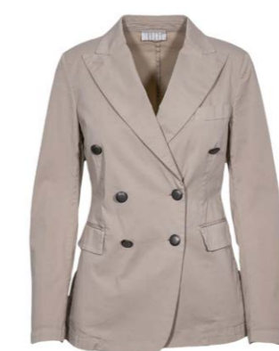
Kiltie Blazer Lauren 380,00 €