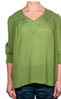
Joyce & Girls Bluse Pauline 250,00 €