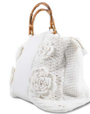
La Milanese Shopper Sofia Weiß 380,00 €