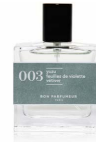
Bon Parfumeur Duft 003 42,00 €