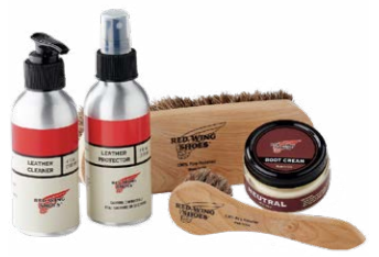
Red Wing Smooth-Finished Leather Care Kit 40,00 €