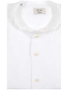
DU4 Leinenhemd Albert Stehkragen 150,00 €