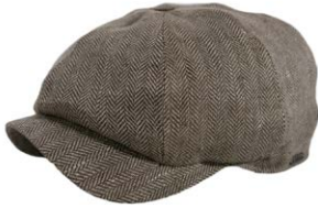
Wigens Newsboy Classic Cap Oliv Fischgrat 100,00 €