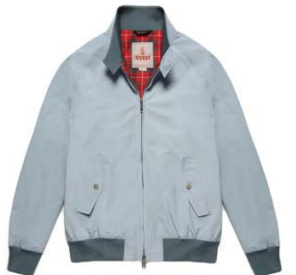
G9 Blouson Cloud 390,00 €