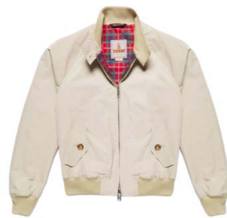
Damen G9 Blouson Natural 390,00 €