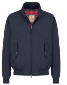
G9 Blouson Navy 390,00 €

▶ Diesem Charme ist auch so manche Berühmtheit seit Bestehen von Baracuta verfallen. Das englische Weltcup Team von 1974 läuft in den Jacken auf, Ikonen wie Elvis Presley, Steve McQueen, Frank Sinatra, David Beckham, Daniel Craig und Robert Downey Junior kann das Label zu seinen Fans zählen.