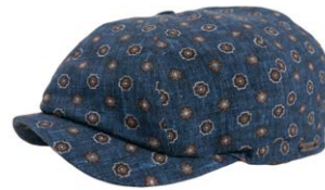
Wigens Newsboy Cap Blau Geblümt 100,00 €