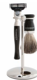
D.R. Harris Ebony Rasier-Starterset 125,00 €