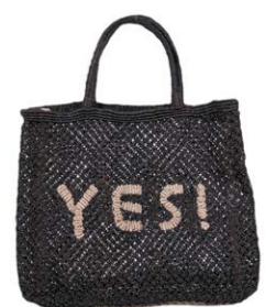
Yes Navy 120,00 €