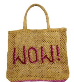
WOW! Geld 90,00 €