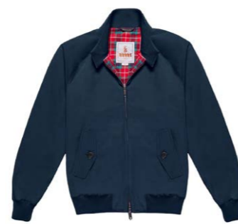
Damen G9 Blouson Navy 390,00 €