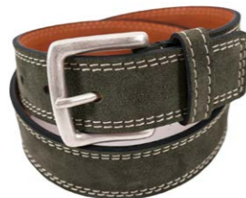
Themata Gürtel Vals 140,00 €