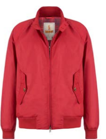
G9 Blouson Dark Red 390,00 €