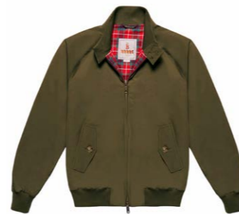
Damen G9 Blouson Beech 390,00 €

Alle Produkte in diesem Newsletter sind klickbar!