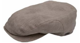
Wigens Ivy Classic Cap Khaki 100% Leinen 70,00 €