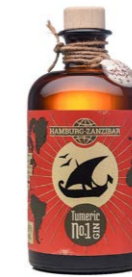
Hamburg-Zanzibar Tumeric No 1 Gin 42,00 €