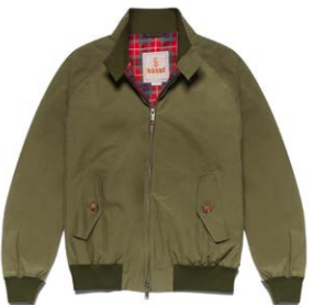
G9 Blouson Army 390,00 €