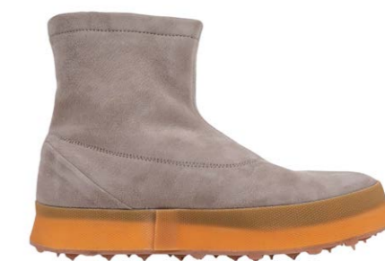
Shoto Damen Chelsea Boot 450,00 €