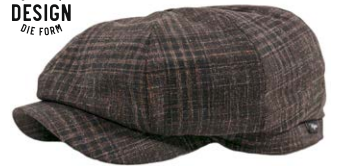
Wigens Newsboy Cap Braun Kariert 100,00 €