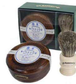
D.R. Harris Windsor Rasier-Set Mahagoni 84,95 €