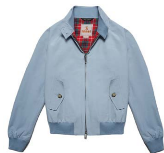
Damen G9 Blouson Cloud 390,00 €