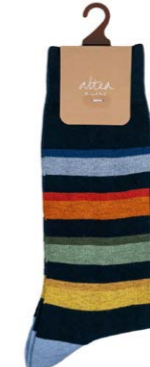
Altea Baumwollsocken Ringel 23,00 €