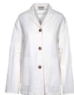
Kiltie Jacke Daria 450,00 €