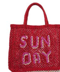
Sunday 90,00 €