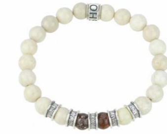
19-021 Dinosaurierknochen 170,00 €

Prähistorisches Mammut-Elfenbein oder eine Kugel aus dem „Campo del Cielo“-Meteorit in einem handgearbeiteten Armband? Shoto Sterling zeigt, wie das möglich ist: Made in Germany, nach uralter Tradition der Navajo Indianer von Hand hergestellt. Ein Shoto Armband spiegelt die ganze Welt in ihrer Schönheit, Harmonie und ihren Abläufen wider. Runde Steinperlen aus Jaspis, Jade und Peridot begeistern mit herrlichen Naturtönen. Besondere Hingucker sind die teilgeschwärzten Silberteile und prähistorischen Funde, die als Glanzlichter und Einzelstücke eingearbeitet werden. Neugierig geworden? Dann lassen Sie sich hier inspirieren!