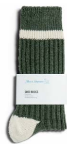
Merz b. Schwanen recycled socks 19,00 €