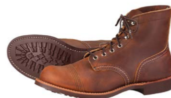
Red Wing Iron Ranger 8085 330,00 €