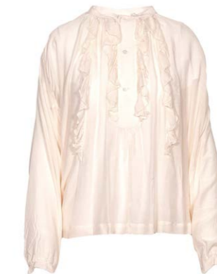
Semicouture Rüschen Bluse 190,00 €

Alle Produkte in diesem Newsletter sind klickbar!