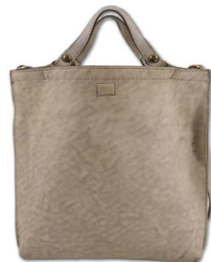
Campomaggi Tasche Shopper 270,00 €