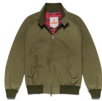
Damen G9 Blouson Army 390,00 €