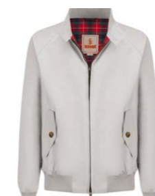
G9 Blouson Mist 390,00 €