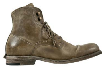
Shoto Stiefel Hirschleder Oliv 470,00 €