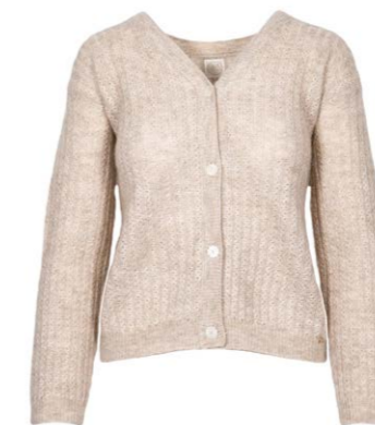
Des Petits Hauts Strickjacke Bella 190,00 €