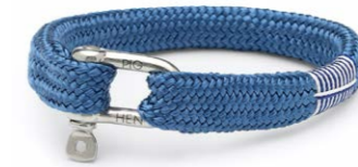
Pig & Hen Sharp Simon Mittelblau 54,95 €