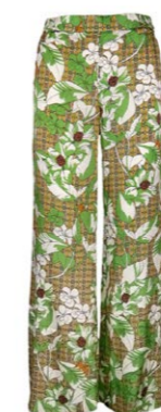
Joyce & Girls Hose 260,00 €