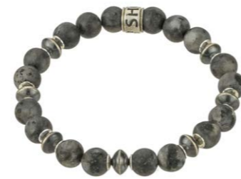
20-024 Navajo 130,00 €