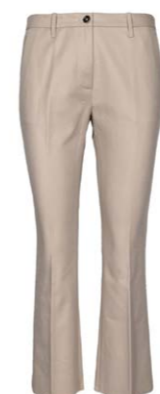
nine:inthe:morning Hose Rome Beige 190,00 €