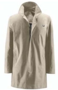
UBR Mantel Maestro 7027 500,00 €

Casual Business, ist leichter und lockerer, spiegelt die modischen Einflüsse wider und Mann ist trotzdem gepflegt angezogen. Legere und doch ernsthaft. Und gut aussehend.