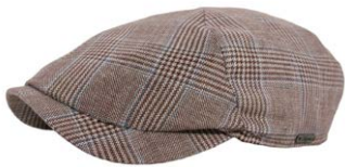
Wigens Newsboy Slim Cap Hellbraun 95,00 €