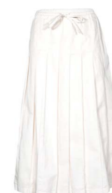
Semicouture Plissee-Midi-Rock 220,00 €