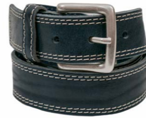
Themata Gürtel Gohl 129,95 €