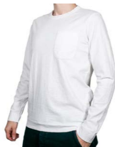
Original Vintage Style Longsleeve Sloan 85,00 €