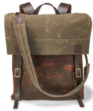
Red Wing Shoes Canvas Rucksack 400,00 €