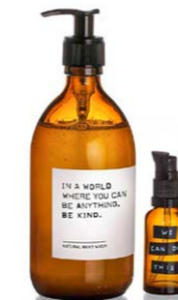
Property of... Natural Hand Wash 15,00 €