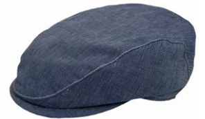
Wigens Ivy Slim Cap Mittelblau 75,00 €