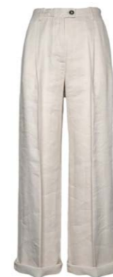
nine:inthe:morning Hose Alice Beige 220,00 €