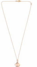
Nicola Hinrichsen Halskette Cleia Mini Weiß 170,00 €