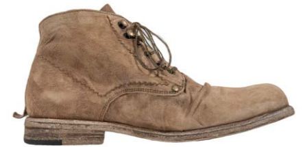
Shoto Boot Velourleder Beige 500,00 €