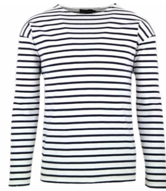
Armor Lux Matrosenshirt 70,00 €