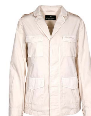
Mason's Damen Field Jacket 220,00 €