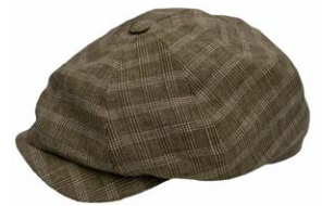
Wigens Newsboy Classic Cap Oliv 100% Leinen 80,00 €