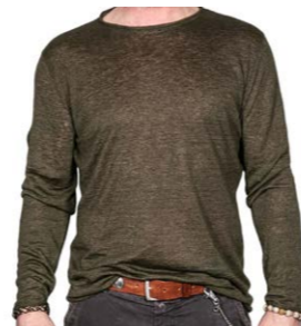
Seldom Leinenshirt Oliv 120,00 €