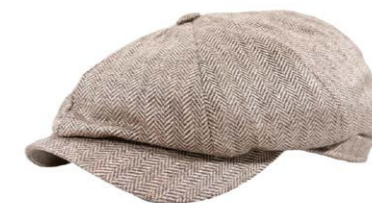
Wigens Newsboy Classic Cap Beige Fischgrat 100,00 €