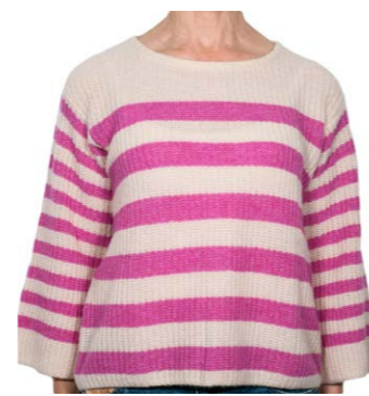
HEMISPHERE Kaschmirpullover Streifen 380,00 €

Mehr zur Story: die-form.de/stories/fashion-stories/die-ersten-sonnenstrahlen/