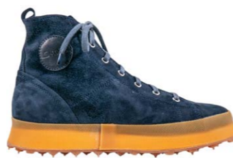
Shoto Damen Boot 450,00 €