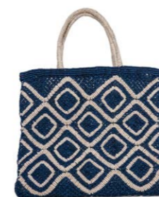
Ingrid Navy 120,00 €

Damit erfüllen The Jacksons eine Mission, die Ihnen sehr am Herzen liegt: so viele Arbeitsplätze wie möglich zu schaffen.