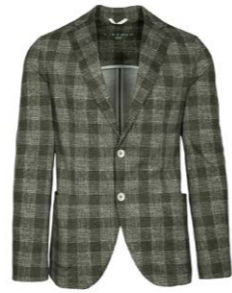
Circolo 1901 Jersey Sakko Kariert 450,00 €