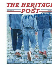
The Heritage Post Denim Sonderausgabe 12,50 €