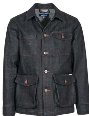
Blaumann Kuroki Denim Jacke 400,00 €