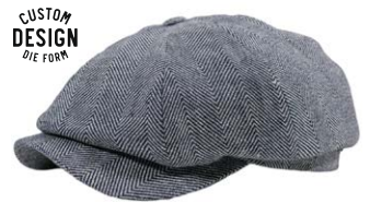
Wigens Newsboy Cap Leinen Blaugrau 100,00 €