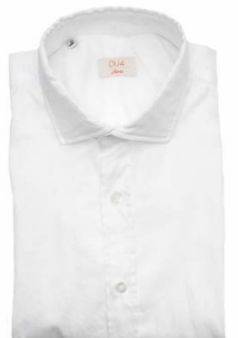
DU4 Hemd Pavia Weiß 130,00 €