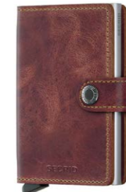
Secrid Miniwallet Vintage Brown 50,00 €

Alle Produkte in diesem Newsletter sind klickbar!