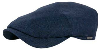
Wigens Newsboy Slim Cap Leinen Navy 100,00 €