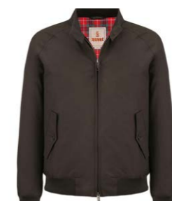
Blouson Faded Black 390,00 €