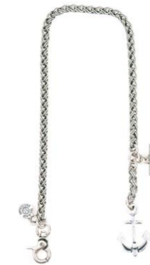
THEMATA Uhrenkette Anker 126 89,95 €