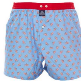
McAlson Boxer 4342 35,00 €