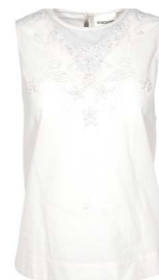
Semicouture Top 160,00 €