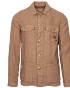
Altea Worker Jacke aus Leinen 400,00 €