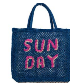
Sunday 90,00 €