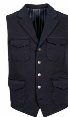
Borelio Weste Gini 180,00 €