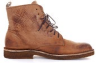
Bootflex Special Edition Heritage 270,00 €