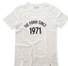
Merz b. Schwanen Genderless T-Shirt | Limited 1971 Edition 70,00 €