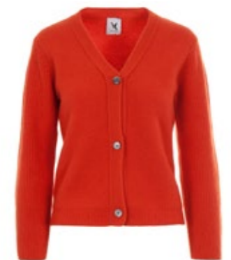
Kaschmir Cardigan Harwan Orange 490,00 €