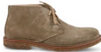
Greenflex Stone 180,00 €