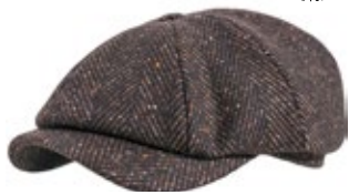
Wigens Newsboy Cap Fischgrat Braun 80,00 €