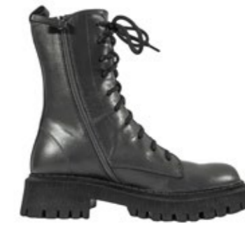
Bibi Lou Schnürstiefelette Verde-Khaki 220,00 €