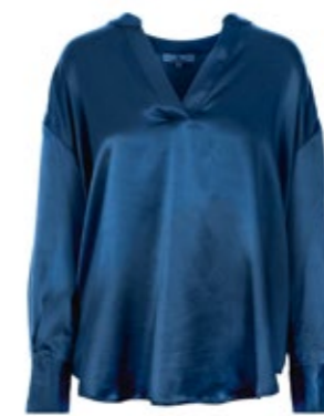
Seidenbluse Sparky Blau 270,00 €