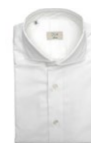
DU4 Hemd Davis Techno-Stretch 170,00 €