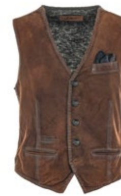
The Jack Leathers Lorry Burned Suede Weste 230,00 €