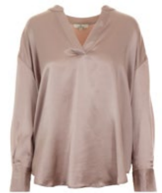
Seidenbluse Sparky Beige 270,00 €