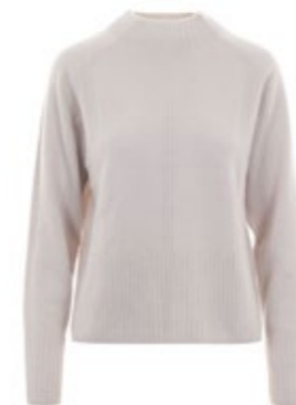
Kaschmirpullover Juliette Beige 290,00 €