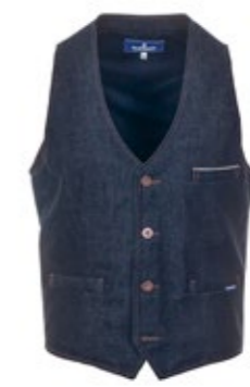
Blaumann 12,5 oz schmale Denim Weste 220,00 €