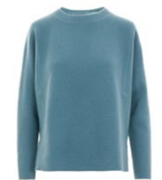
Van Kukil Kaschmirpullover Haisley 450,00 €