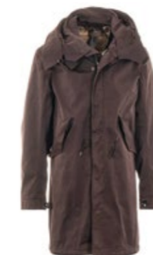
Ten C Parka Braun 1.480,00 €