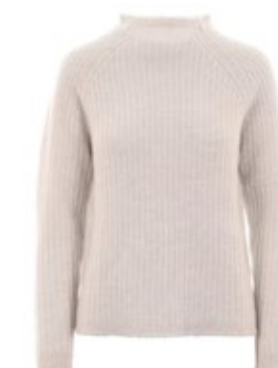
HEMISPHERE Kaschmir Strickpullover Natur 450,00 €

Alle Produkte in diesem Newsletter sind klickbar!