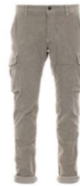
Mason's Cargohose Cord Chile 220,00 €