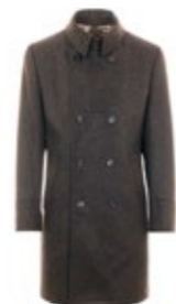
1973 Mantel Manu 600,00 €