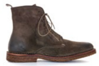
Bootflex Forresta 230,00 €