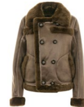
Urbancode Jacke Faux Leather 320,00 €