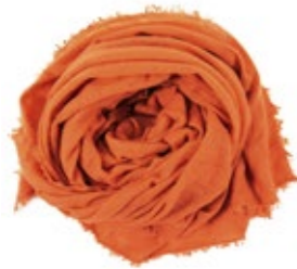
Kaschmirschal Mandarin 220,00 €