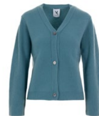
Kaschmir Cardigan Harwan Mint 490,00 €