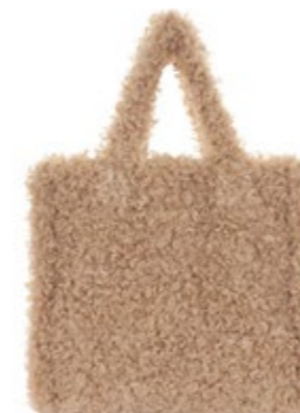
Maliparmi Shopper Tasche 220,00 €