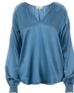
Seidenbluse Want Me Blau 280,00 €