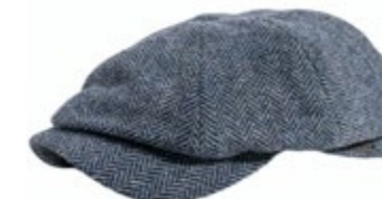
Wigens Newsboy Cap Hellblau 90,00 €