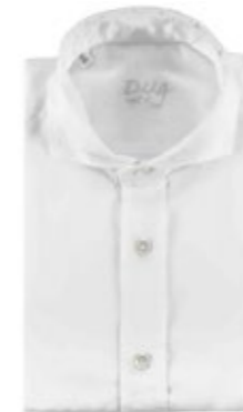
DU4 Hemd Stan 130,00 €