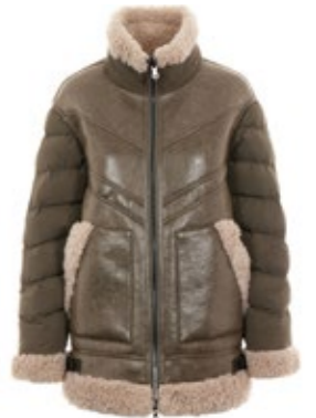
Urbancode Jacke 18792 380,00 €