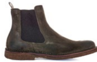
Bitflex Forresta 220,00 €