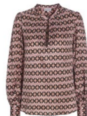
Dea Kudibal Seidenbluse Stacy Imperial Princess 250,00 €