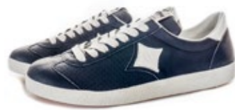
Brütting Diamond Brand Sneaker Melbourne | Limited 1971 Edition 280,00 €