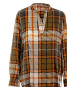
Caliban Bluse Retro Gitter 290,00 €