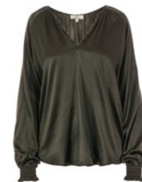
Seidenbluse Want Me Oliv 280,00 €