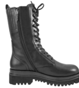
Lola Cruz Schnürboots Black 340,00 €

Alle Produkte in diesem Newsletter sind klickbar!