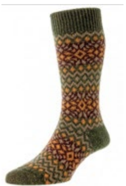
Scott-Nichol Tweed Socken Fellcroft 22,00 €