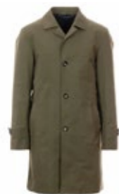
1973 Mantel Stanford 500,00 €