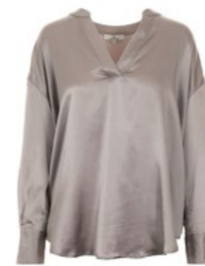
Seidenbluse Sparky Grau 270,00 €