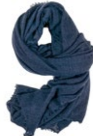
Kaschmirschal Navy 220,00 €