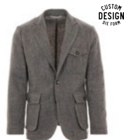
Borelio Sakko Vector Fischgrat 550,00 €