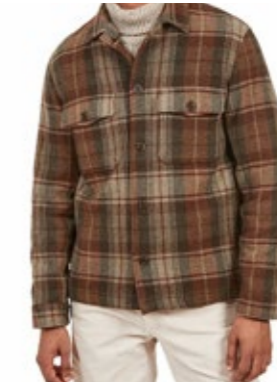
Hartford Tweed Overshirt aus Wolle 385,00 €