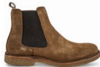
Bitflex Dark Khaki 200,00 €