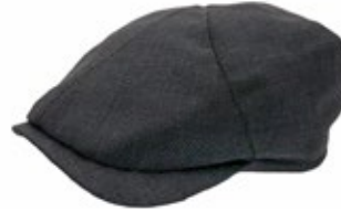
Wigens Newsboy Slim Cap Anthrazit 80,00 €