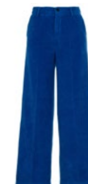
true nyc Cordhose Olly 220,00 €