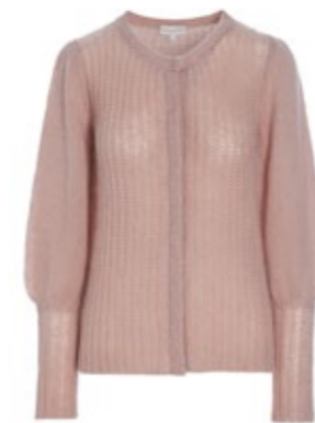
Dea Kudibal Cardigan Jenny Dusty Rose 200,00 €

Mehr zur Story: die-form.de/stories/fashion-stories/herbstgefuehle-mit-jill/