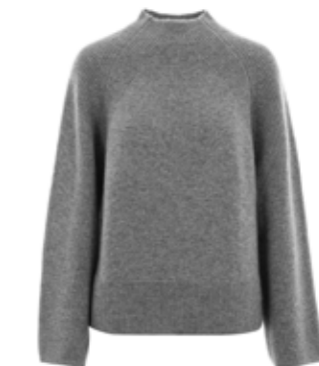
Kaschmirpullover Mika Grau 450,00 €