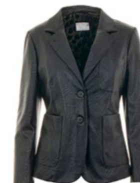
Kiltie Blazer Lin Black 450,00 €