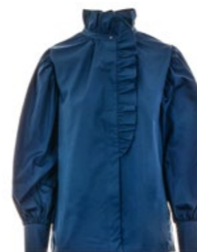
tonno & panna Baumwollbluse Kalina 180,00 €