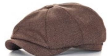
Wigens Newsboy Classic Cap Schurwolle Braun 100,00 €