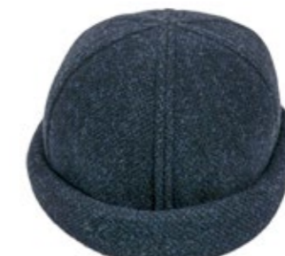
Wigens Docker Cap Navy 80,00 €