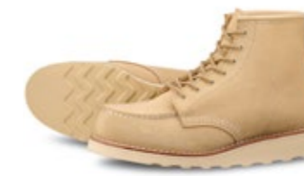
Damen Red Wing Moc Toe 3328 330,00 €