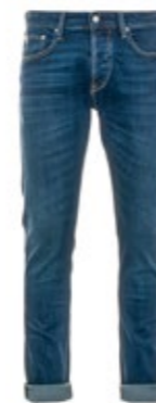
The.Nim Jeans 925 Morrison ODK 180,00 €