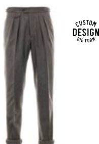
Borelio Hose Benny Fischgrat 320,00 €