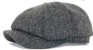
Wigens Newsboy Classic Cap Finn Anthrazit 90,00 €