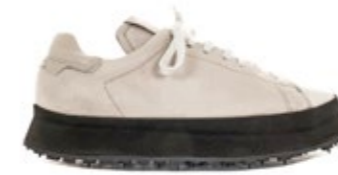
Shoto Damen Sneaker 2463 Creme 450,00 €