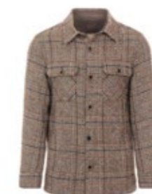
1973 Jacke 7055 Miles Beige 330,00 €