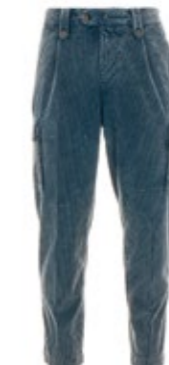
Myths Cargohose Fancycord 230,00 €