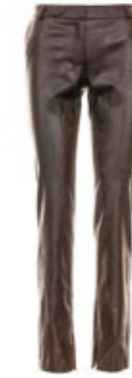
Kiltie Hose Floor in Lederoptik 220,00 €