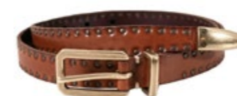
Gavazzeni Gürtel 33806 150,00 €