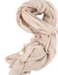
Kaschmirschal Oyster 220,00 €