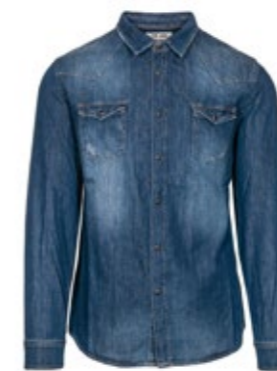
The.Nim Jeanshemd Western-Style W580 160,00 €