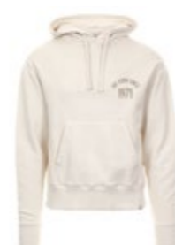
Merz b. Schwanen Kapuzenpullover Limited 1971 Edition 145,00 €