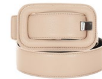
Gavazzeni Gürtel 34529 110,00 €