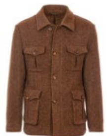
1973 Jakko Cooper 390,00 €