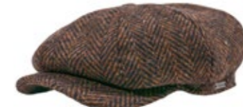
Wigens Newsboy Arthur Retro Cap Fischgrat Braun 110,00 €