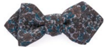
Blick Schleife Andre Geblümt 40,00 €