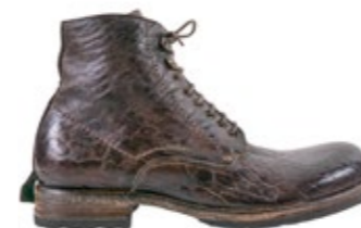
Shoto Stiefel Bisonleder 470,00 €