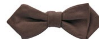
Ascot Schleife Seide Braun 65,00 €