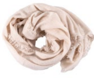
Kaschmirschal Snowflake 220,00 €