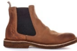
Bitflex Special Edition Heritage 260,00 €