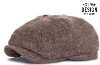
Wigens Newsboy Classic Cap Limited 1971 Edition 80,00 €