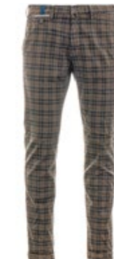
Mason's Hose Torino Glencheck Slim Fit 200,00 €