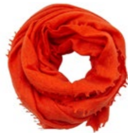
Kaschmirschal Orange 220,00 €