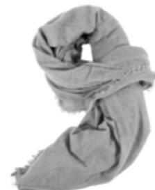
Kaschmirschal Stone 240,00 €