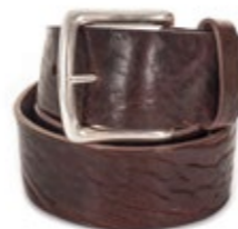
Themata Gürtel Birenz Limited 1971 Edition 130,00 €