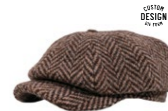
Wigens Newsboy Classic Cap Wolle 110,00 €