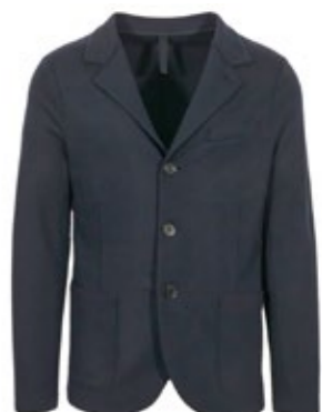
Harris Wharf Sakko Marine 430,00 €