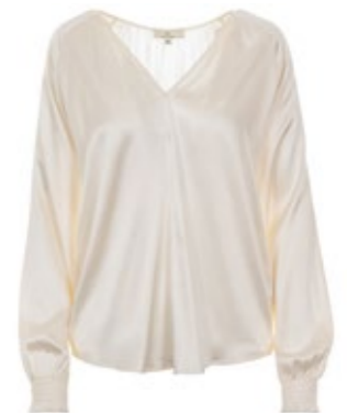
Seidenbluse Want Me Natur 280,00 €