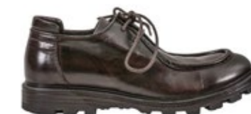
Shoto Damen Schuh Pferdeleder 450,00 €