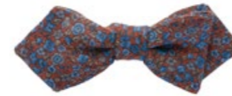
Hemley Schleife Rost 60,00 €