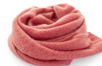
Des Petits Hauts Schal Apoline 130,00 €