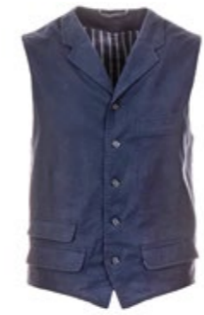
Borelio Weste Gini Twill 180,00 €