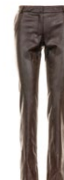
Kiltie Hose Floor in Lederoptik 220,00 €