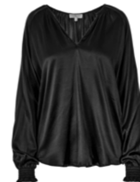
Seidenbluse Want Me Schwarz 280,00 €