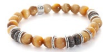
Shoto Sterling 22-005 Tigerauge Dinosaurierknochen 290,00 €