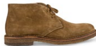
Greenflex Whiskey 180,00 €