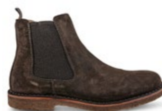
Bitflex Dark Chestnut 200,00 €