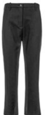
nine:inthe:morning Hose Magda Black 260,00 €