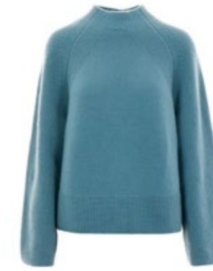
Van Kukil Kaschmirpullover Mika 490,00 €