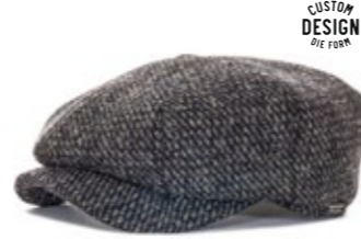
Wigens Newsboy Retro Cap Limited 1971 Edition 100,00 €