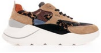
D.A.T.E. Sneaker Fuga Leopard Beige 230,00 €