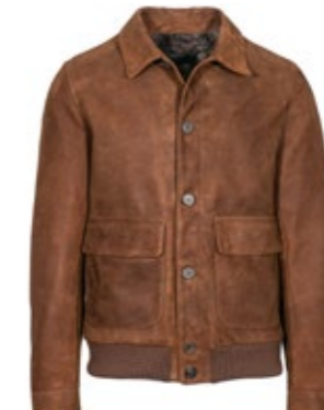
GMS-75 Lederblouson 950,00 €