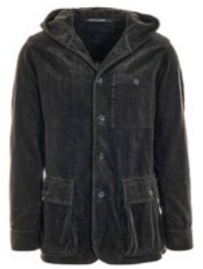
Hannes Roether Sakko Angus mit Kapuze 460,00 €