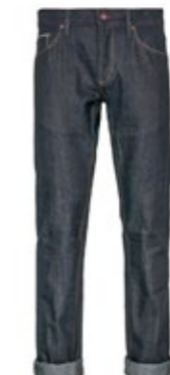
schmalere Blaumann 15 oz 260,00 €