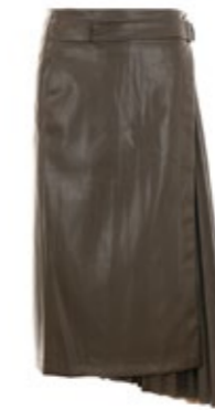
Urbancode Rock Khaki 380,00 €