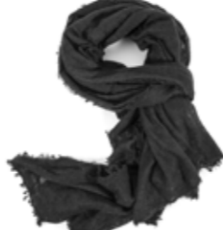
Kaschmirschal Black 240,00 €