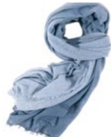
Kaschmirschal China Blue 240,00 €