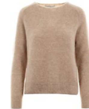
Johnny Love Strickpullover Alicia 200,00 €