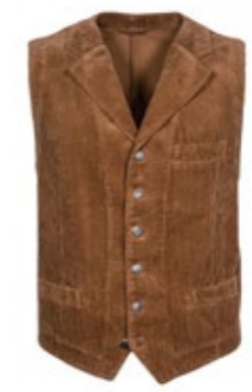
Borelio Cordweste Ginlemon 150,00 €