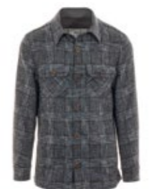
1973 Overshirt 5015 Miles 370,00 €