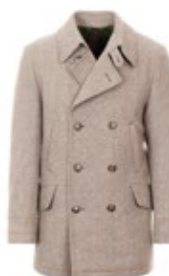
1973 Kurzmantel Duke Fischgrat 500,00 €