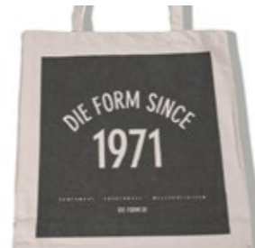
die form Canvas Shopper Bag Limited 1971 Edition 5,00 €