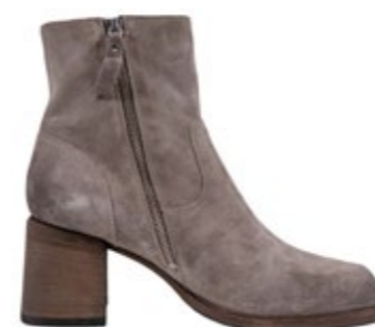
Vic Matié Stiefel Taupe 340,00 €

Alle Produkte in diesem Newsletter sind klickbar!