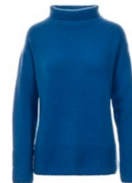
Kaschmirpullover Britt 490,00 €

„Van Kukil“ widmet sich seit mehreren Generationen dem Erhalt und der Förderung der Region Kaschmir und ihrer Bewohner, sowie der Herstellung qualitativ hochwertiger Kleidung aus dem Edelhaar der Kaschmirziegen. Das Ergebnis sind unglaublich gemütliche Kleidungsstücke mit tollem Tragekomfort und dem guten Gewissen, dass diese ausschließlich von den Kaschmirziegen aus dem Himalaya stammen.