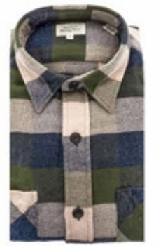
Hartford Overshirt Percy Flanell 155,00 €