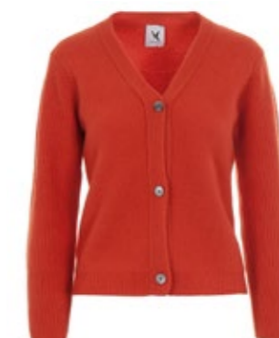
Van Kukil Kaschmir Cardigan Harwan 490,00 €