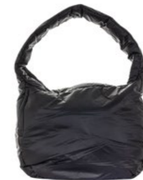
Liviana Conti Shopper Schwarz 140,00 €