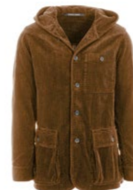
Hannes Roether Sakko Angus mit Kapuze 460,00 €