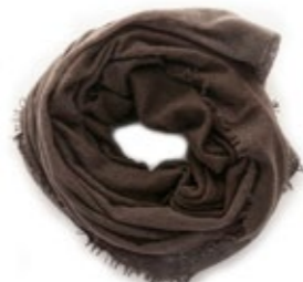
Kaschmirschal Lava Braun 240,00 €