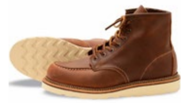
Red Wing Moc Toe 1907 350,00 €