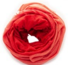
Kaschmirschal Lava Rot 240,00 €