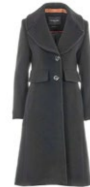
Maison Lener Mantel Topologic 800,00 €