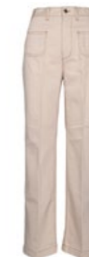
true nyc Jeans Sally Natur 200,00 €