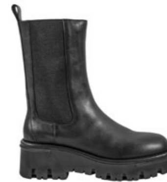
Lola Cruz Stiefel Chelsea 300,00 €