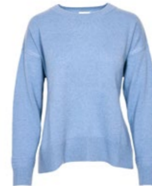
Kaschmirpullover Camila 330,00 €