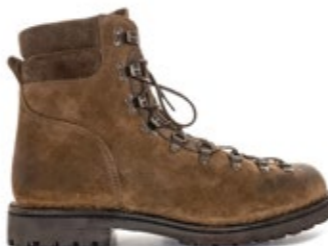
Rockflex Bergsteiger 290,00 €