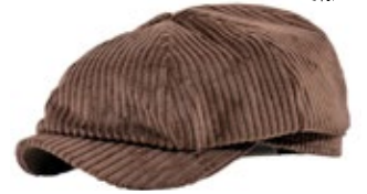
Wigens Newsboy Cap Cord Braun 100,00 €