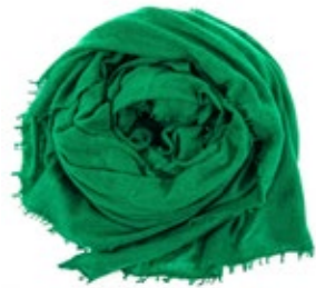
Kaschmirschal Emerald 220,00 €

Die spezielle Handwerkskunst, welche exklusiv in der Region Kathmandu beheimatet ist und dort hoch geschätzt wird, verleiht der Verarbeitung ihre unnachahmliche Qualität.