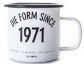
die form Emaille Becher Limited 1971 Edition 10,00 €