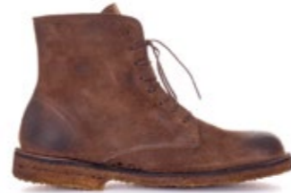
Bootflex Special Edition Heritage Velour 240,00 €