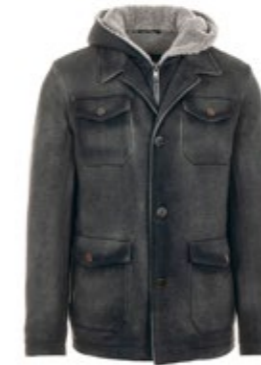
GMS-75 Fieldjacket mit Kapuze 1.000,00 €