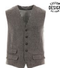
Borelio Weste Gini Fischgrat 280,00 €