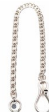
THEMATA Schlüsselkette 116 140,00 €