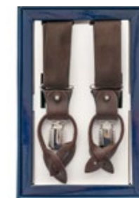
Ascot Hosenträger Seide Braun 65,00 €