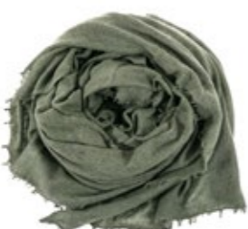
Kaschmirschal Oliv 220,00 €