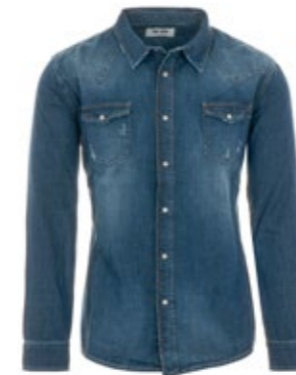
The.Nim Jeanshemd Western-Style W397 175,00 €