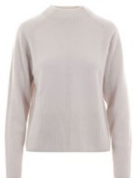
Van Kukil Kaschmirpullover Juliette 290,00 €