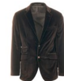
1973 Sakko Samt 530,00 €