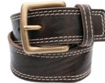
Themata Gürtel Gohl Doppelnaht 80723 130,00 €