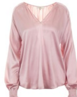
Seidenbluse Want Me Rosa 280,00 €