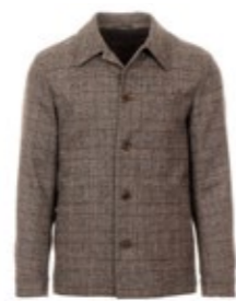
1973 Jakko Garret Kariert 370,00 €