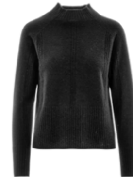
Kaschmirpullover Juliette Schwarz 290,00 €